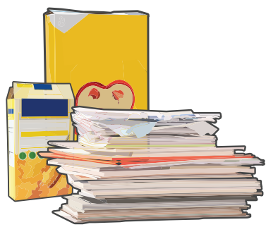
Papel (de todo color y tipo)