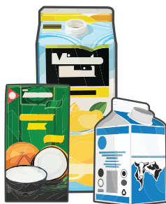
Cartones de comestibles (vacíos y limpios)