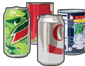
Latas de aluminio y acero (vacías y limpias)