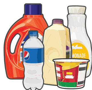
Envases de plástico (vacíos y limpios)