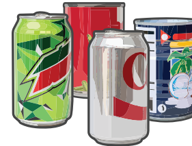
Aluminum and Steel Cans (empty and clean) Latas de aluminio y acero (vacías y limpios)