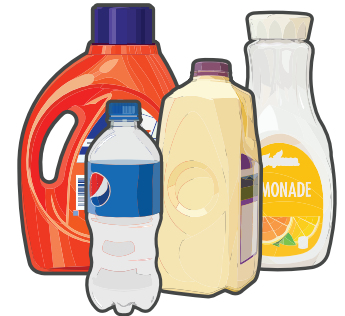
Plastic Bottles, Jars and Jugs (empty and clean) Envases de plástico (vacíos y limpios)