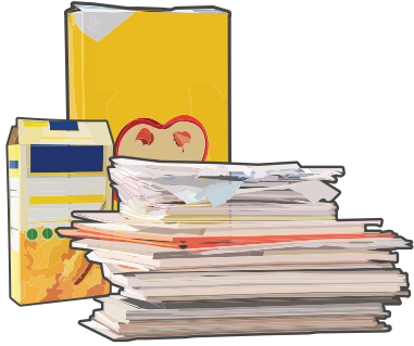
Paper (all colors and types) Papel (de todo color y tipo)