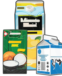
Food Cartons (empty and clean) Cartones de comestibles (vacíos y limpios)